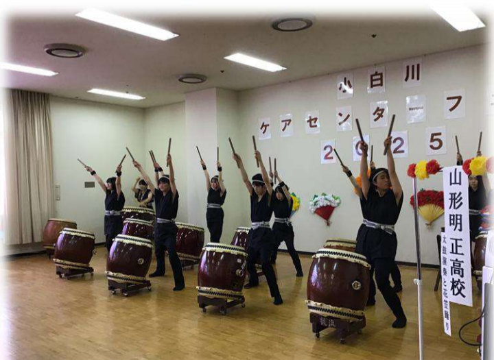
写真：2025年の小白川ケアセンターフェアの様子です