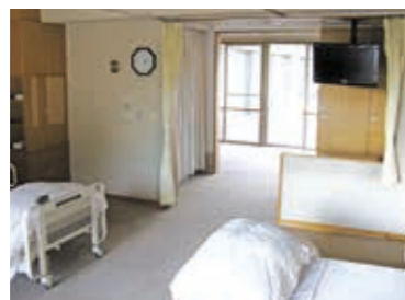
ショートステイ居室

要介護、要支援の認定を受けた高齢者が一時的に入所し、食事・入浴・排泄等、日常生活全般の介護を受けることが出来るサービスです。本人の心身の特性を踏まえて、能力に応じた自立した日常生活が営むことができるよう援助し、利用者の家族の身体的及び精神的負担の軽減を図れるように心がけています。