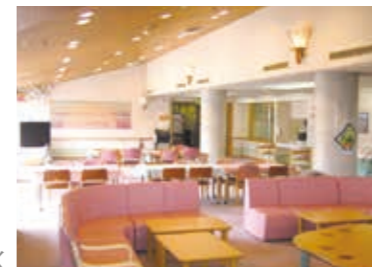
デイサービスホール

利用者様が住み慣れた自宅で安心して暮らせるよう、介護福祉士・看護師・機能訓練指導員による専門的なサービスを提供いたします。特に機能訓練と看護体制の強化を図っており、徹底した安全管理のもと「立つ・歩く」といった生活動作の中で最も基本的で重要な能力の維持・向上を支援します。また認知症の方や在宅酸素、経管栄養等の医療的なケアを必要とする方もご利用いただけます。