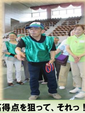
高得点を狙って、それっ！