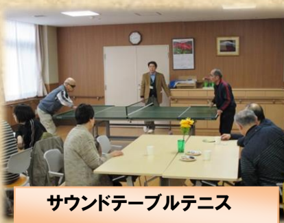
サウンドテーブルテニス