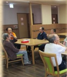
いち・に・さん・し〜♪(お茶会)