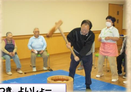
餅つき、よいしょー