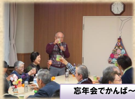
忘年会でかんぱ〜い！