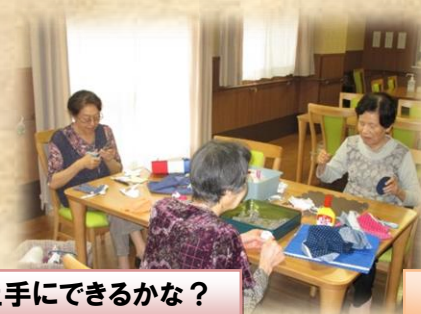
上手にできるかな？