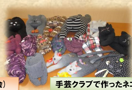
手芸クラブで作ったネコ勢ぞろい