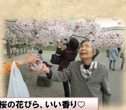
桜の花びら、いい香り♡