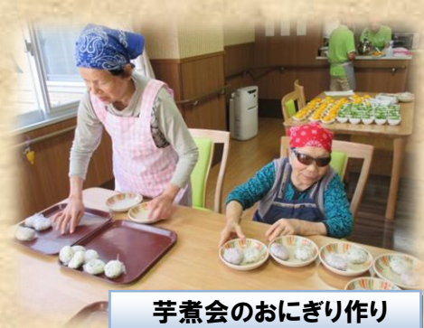
芋煮会のおにぎり作り