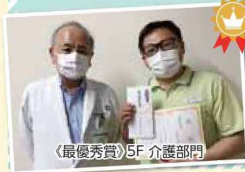
《最優秀賞》5F 介護部門